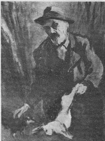
Jägermotiv von Ernest Bolens.

Der an zeitgenössische Malerei Gewöhnte mag sich fragen, worin denn nun eigent-