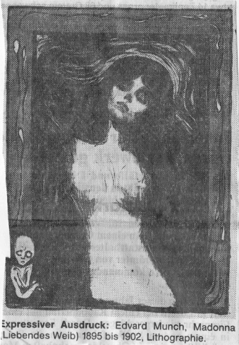
Expressiver Ausdruck: Edvard Munch, Madonna (Liebendes Weib) 1895 bis 1902, Lithographie.

tion in der – unabhängig vom naturalistischen Vorbild – niemals von einer Idee ausgeht, sondern von einer «Suche nach Schwerpunkten», die dann im Verlauf des Arbeitsprozesses figürlichen Charakter annehmen können. «Ich male und zeichne ja, damit ich diese Dinge sehe, damit ich auf sie komme. Das ist die einzige Motivation zum Malen und Zeichnen», sagt Anzinger. Es geht in seinem Schaffen also um zwei Dinge. Einerseits um die Suche nach individueller Freiheit im Bild, losgelöst von sämtlichen akademischen Begriffen, andererseits um eine Art Selbsterfahrung. Hässliches wird dabei ebenso akzeptiert wie Misstratenes und/oder Gelungenes. Im Gegensatz zu vielen seiner malenden Altersgenossen findet jedoch im Anschluss an den eigentlichen Malprozess, der in der Zeichnung und der Gouache meist sehr kurz ist, eine bewusste Reflexion über das «Passierte» statt, was sich zweifellos als «Nahrung» für weitere Blätter auswirkt. Denn ohne je seriell zu arbeiten, stehen die Arbeiten doch in einem engen Zusammenhang, sind sie alle in der selben Bildsprache «geschrieben». Es kommt als positives Erlebnis hinzu, dass Anzingers neue Arbeiten ein ausserordentlich breites Spektrum an Bild-Bau-Möglichkeiten aufweisen. (Die Ausstellung in Basel dauert bis zum 28. Juli; sie geht anschliessend nach Bonn und ist im Februar 1986 in Linz zu sehen.)