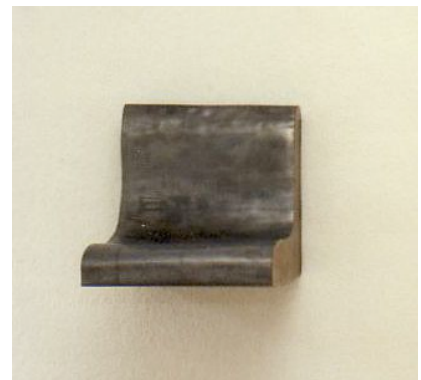
Cathrin Lüthi K, Wandstück, gefüllt, 1992

Vordergrund. In den Arbeiten von Catrin Lüthi K bleibt eine menschliche Dimension erhalten, sowohl real wie im übertragenen Sinn. Es kommt hinzu, dass manche Form an Menschliches, oder, allgemeiner, an Organisches, an einfache Lebensformen, erinnert. Andere, stärker geometrische Arbeiten - sind nicht nur Kontrast. Man kann sich ihnen über das Stichwort Architektur nähern. Es sind