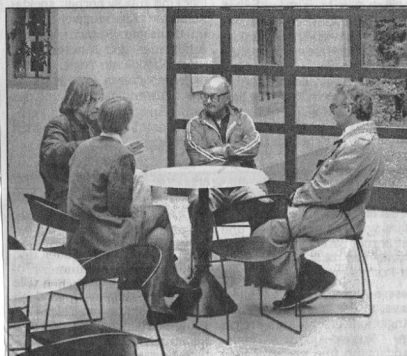
Sol LeWitt (Mitte): Besprechung in Aarau.

xität, welche mit jedem Gedanken über sich selbst hinausweist. Wenn Sol LeWitt 1969 den Rationalisten und den Mystiker in Verbindung brachte, so hat das Sprengkraft. Heute ist Kluft zwischen den Erkenntniswegen der Mystik und der Naturwissenschaften zumindest in Frage gestellt und gerade das macht Sol LeWitts Werk hochaktuell. Im Aargau kommt eine weitere Dimension hinzu. Denn Emma Kunz' berühmter Satz aus den frühen 50er Jahren, wonach ihre Werke Ausdruck der «Gestaltung und Form als Mass, Rhythmus, Symbol und Wandlung von Zahl und Prinzip sei, formuliert Sol LeWitt in ähnlicher Weise, zum Beispiel wenn er sagt: «Zu jedem Kunstwerk, das physisch verwirklicht wird, gibt es viele unausgeführte Variationen». Dass die Forscherin, die wir heute als Künstlerin bezeichnen, durch Intuition dar auf stiess, der Konzept-Künstler durch folgerichtiges Denken, so ist das ein weiterer Baustein zum Schlag zwischen Ratio und Mystik. Aarau ist mit der Plastik von Sol LeWitt ein Stück reicher geworden.