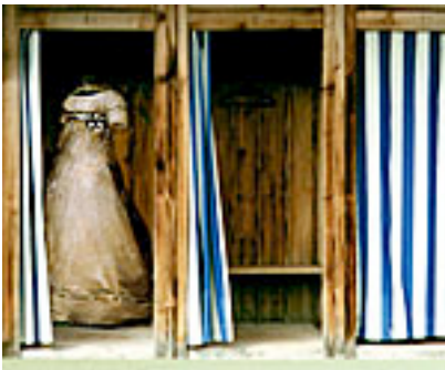
Sie standen da, als wollten sie gehen (Francisco de Goya (1746-1828)) Inkjet-Print auf Netzgewebe 180 x 220 cm 1998