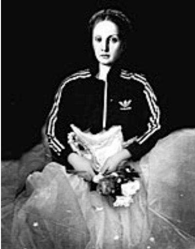
La presence des absents ou la mort de Cleopatra (Bildnis der Lucrecia Panciatichi, 1544) Schwarzweissfotografie 50,8 x 40,6 cm 1998

"das, was dahintersteckt" oder besser noch, das "was das Dahinter vom Davor, das Unten vom Oben trennt oder, umgekehrt, miteinander verbindet" die zentrale Fragestellung ist, mit welcher Irene Naef an die Arbeit geht, unabhängig davon, welches Medium sie dafür nutzt.